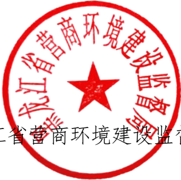
黑龙江省营商环境建设监督局

效办成一件事”的指导意见》（黑政发〔2024〕6号）要求，现将《“企业信息变更‘一件事”工作方案》等13个“一件事”工作方案印发给你们，请结合实际认真贯彻落实。