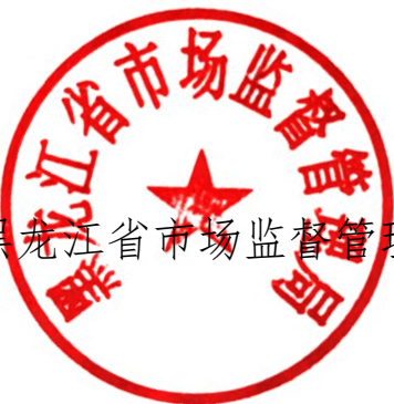
黑龙江省市场监督管理局