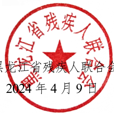
黑龙江省残疾人联合会